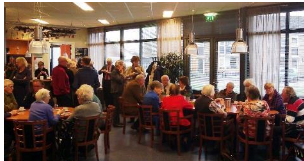
Foto: Koffie na de dienst in Assen

Het project Groentjes – generaties verbinden in gemeenten – begint te landen in gemeenten, zoals u hierboven kunt lezen in de reactie van de Baptistengemeente Assen. Er is een pakket voor gemeenten gepresenteerd in een workshop op de AV waar gemeenten mee aan de slag kunnen: een theoretisch kader, praktische tips en een concreet stappenplan.