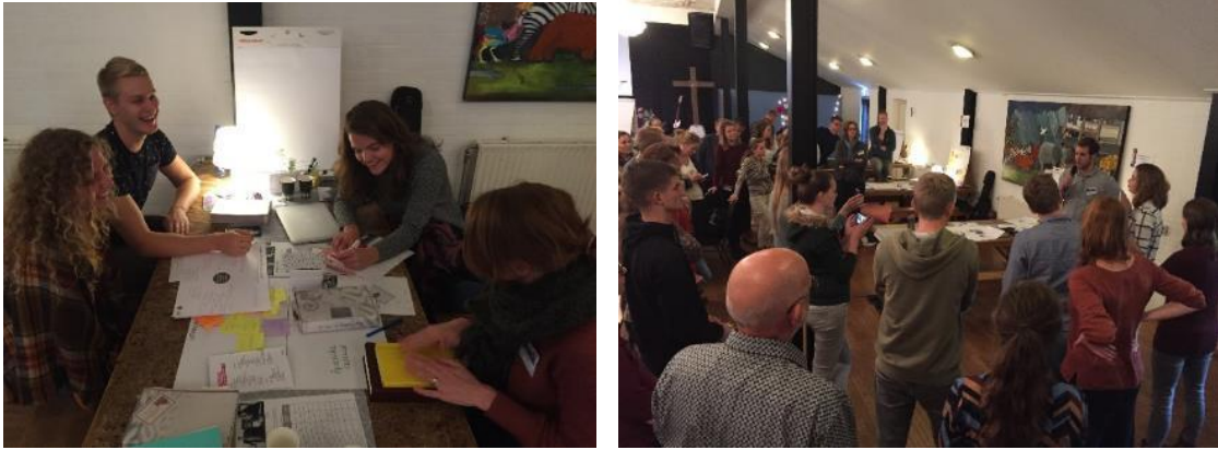
Baptistengemeente Ede Op Doortocht met twee groepen in actie op de LEF-training.